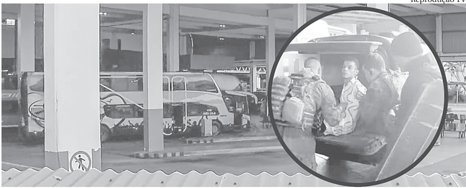
O sequestrador do ônibus feriu duas pessoas na Rodoviária do Rio, em Santo Cristo

Segundo o coronel, a polícia está investigando mais informações sobre a identidade do sequestra-