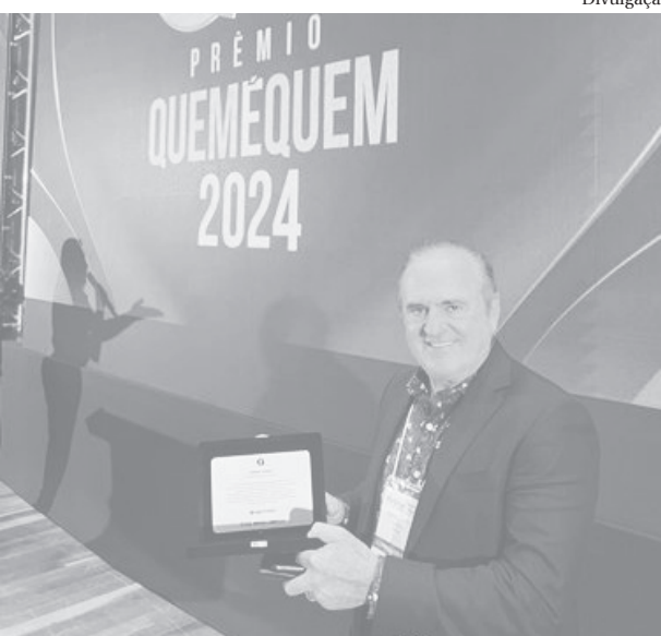
Homenagem destacou a contribuição do empresário para o desenvolvimento do setor avícola nacional

A 23ª edição do evento contou com expositores brasileiros e internacionais no Centro de Eventos da Cooperativa Lar, localizado na Região Oeste do Paraná, onde se concentra o maior complexo produtivo de proteína animal do mundo, próximo a agroindústrias, cooperativas e produtores. ■